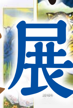
2010年 “(寅)” (岩井幸子 謹画)