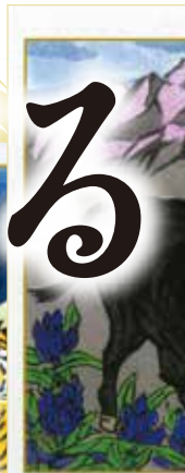
2009年 “魁 寿ぐ(柱)” (岩井幸子 謹画)