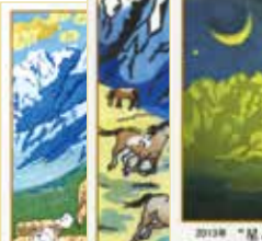
2013年 “昇 龍” (岩井幸子 謹画)