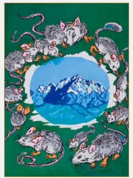
2020年 “大繁盛” (岩井幸子 謹画)