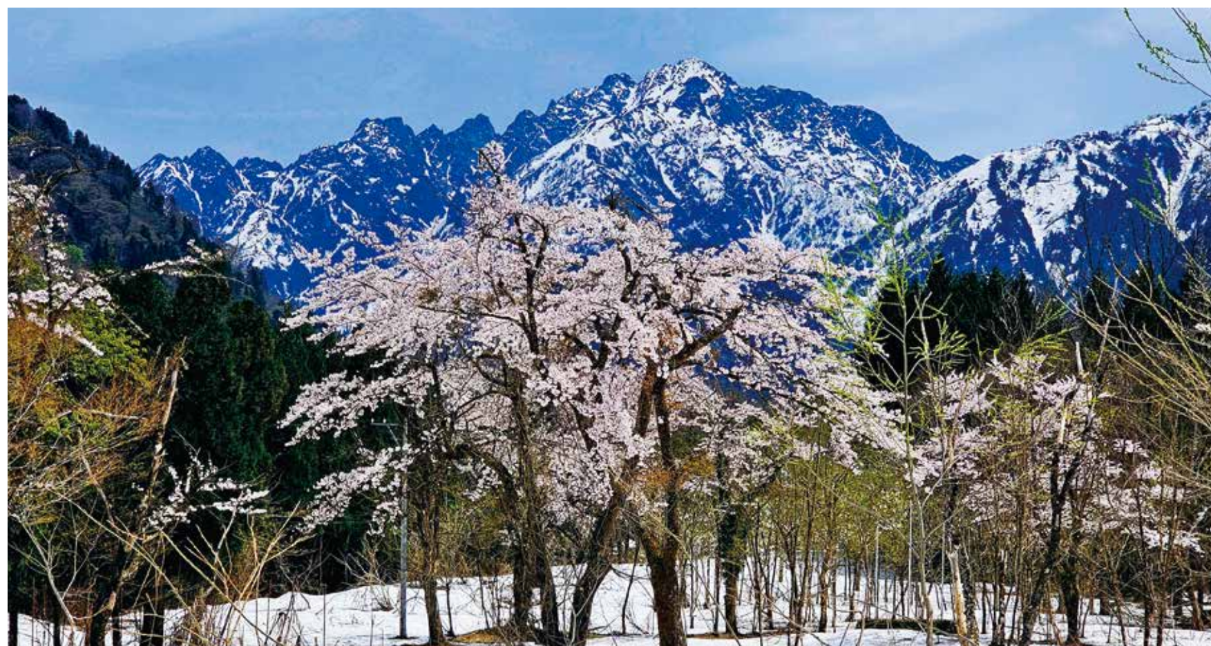
山桜と残雪に映える駒岳（山里の春景）（上市町伊折）