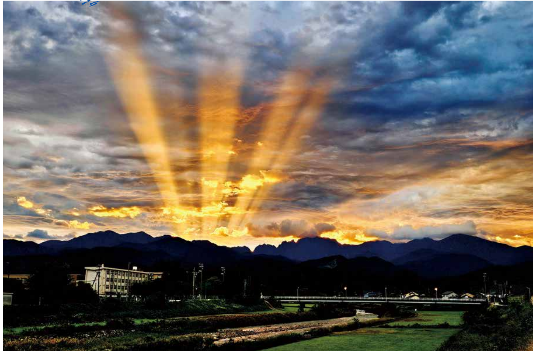
朝光噴出（上市川白竜橋）