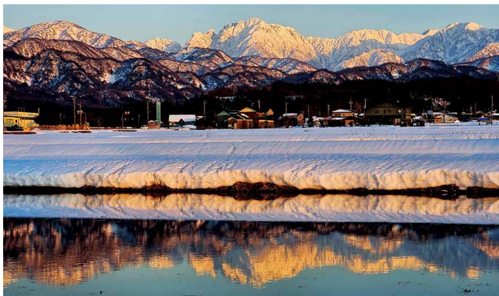
水田に映える駒岳連峰夕景（上市町広野新）