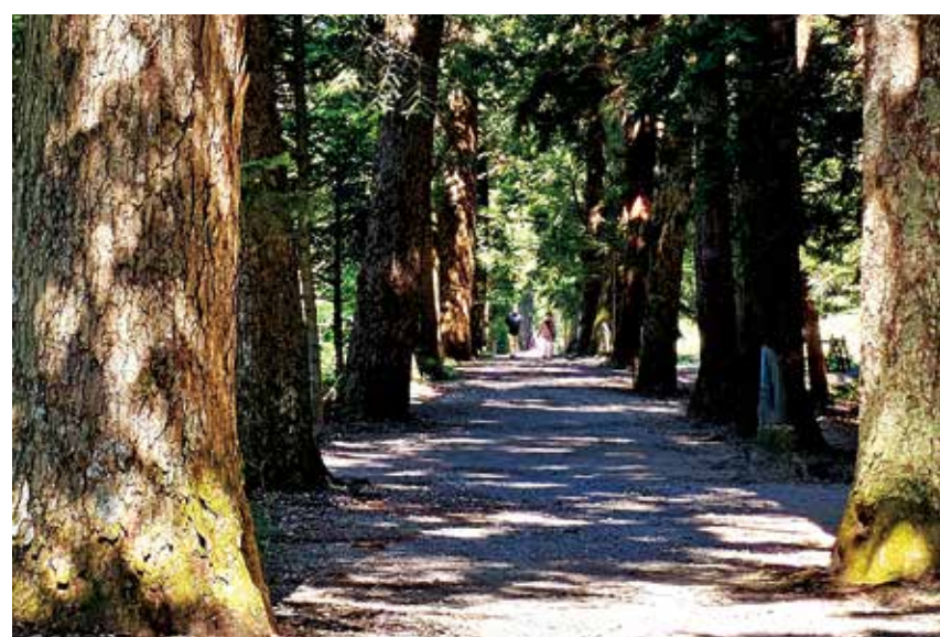
参道（上市町眼目山立山寺）