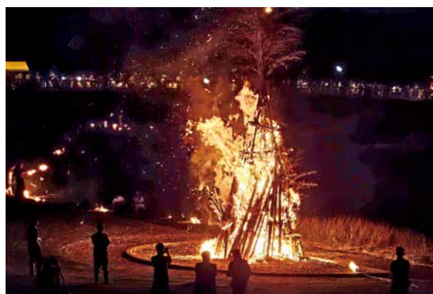
上市まつり におとんぼ（おどる炎）（上市川河川敷）