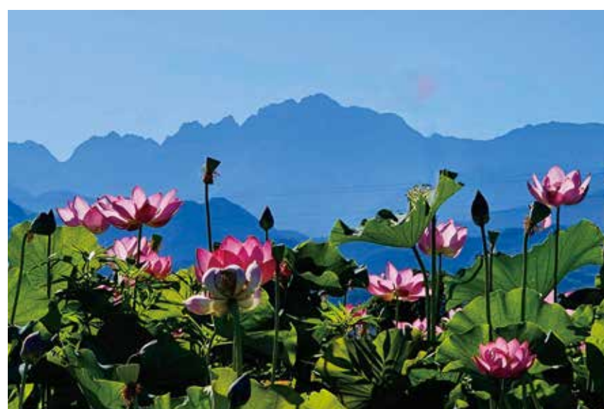
はす花に映える駒岳（上市町神田 はす畑）